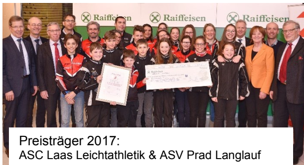
Preisträger 2017: ASC Laas Leichtathletik & ASV Prad Langlauf