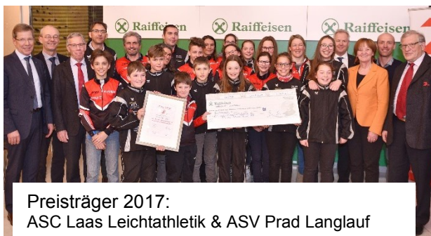
Preisträger 2017: ASC Laas Leichtathletik & ASV Prad Langlauf