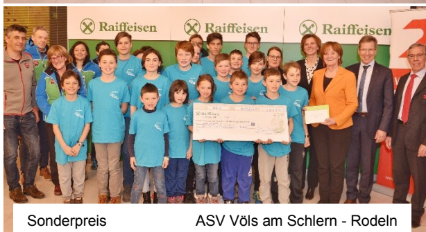
Sonderpreis ASV Völs am Schlern - Rodeln