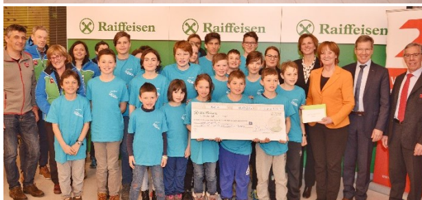
Sonderpreis ASV Völs am Schlern - Rodeln