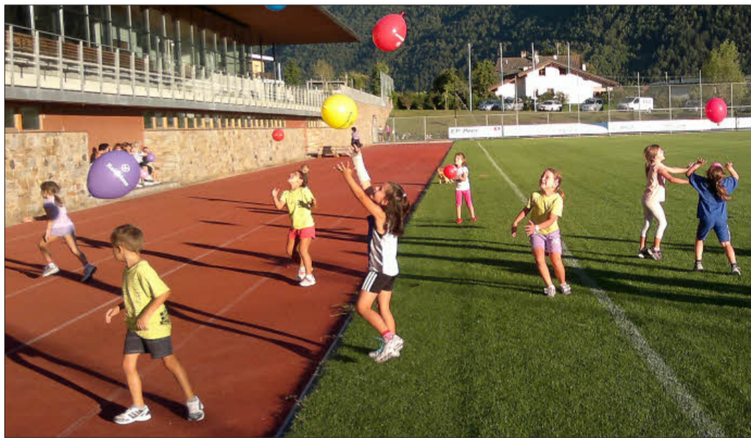
Bewegung und Sport an Südtirols Schulen ist ein Gewinn für Schüler, Lehrer, Trainer und Vereinsfunktionäre.

Das Spannende am VSS-Projekt: Die drei Partnerschaften in den verschiedenen Bezirken entwickelten sich unterschiedlich, jedoch immer zum Vorteil für alle Beteiligten. Während die Kinder im Schulsprengel Lana jährlich neue Sektionen des SV Lana kennen lernten, standen