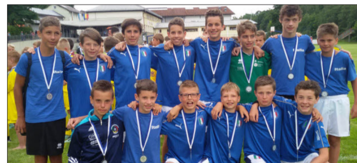
Platz drei für die Auswahl des VSS-Förderzentrums Mitte in Bayern.

FUSSBALL: Südtiroler bei Mini-EM in Bayern aktiv