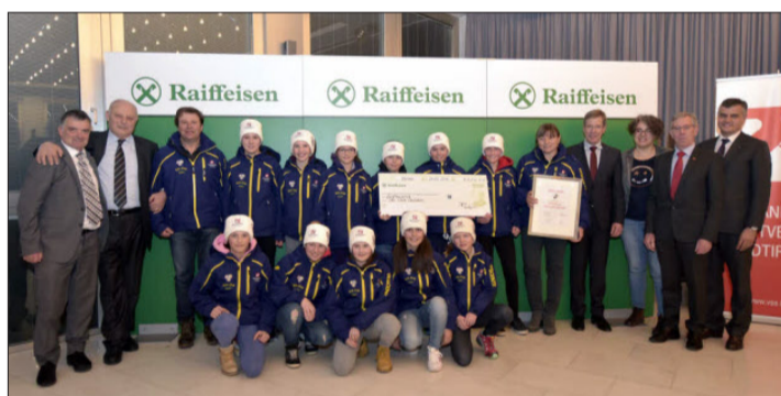
Im Jahr 2015 holte sich der SC Gröden die begehrte VSS-Auszeichnung.