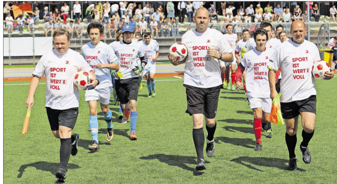
Bei den Fußball-Landesmeisterschaften liefen Schiedsrichter und Spieler mit den offiziellen T-Shirts auf.

Mit dem Motto „Sport ist wert(e)voll“ will der Verband der Sportvereine Südtirols alle am Sport beteiligten Personen, Kinder, Jugendliche, Eltern, Funktionäre, Trainer und Betreuer ansprechen, um die große Bedeutung des Sports für eine gute Entwicklung von Kindern und Jugendlichen hervorzuheben. Damit schließt der VSS an das Motto „Fair Play“ aus den Jahren 2014/2015 an. Damals wurde insbesondere an die Eltern und an die Trainern appelliert, die individuelle Leistung der Kinder und Jugendlichen anzuerkennen, also fair gegenüber ihren Kindern bzw. „Schützlingen“ zu sein, weil Sport und Bewegung, sinnvoll