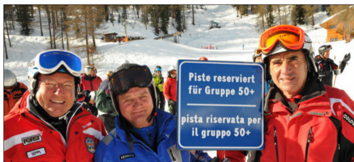
Auch in diesem Winter bietet der VSS Skitreffs für Erwachsene an.

BOZEN. Sport und Bewegung wird im Alter zunehmend wichtiger, schließlich trägt er nicht nur zur körperlichen, sondern auch zur geistigen Fitness bei. Mit den beliebten Ski- und Langlauf-treffs 50PLUS bietet der VSS dank der großzügigen Unterstützung seines Generalsponsors Raiffeisen auch im Winter attraktive Sportprogramme für Sportlerinnen und Sportler über 50 an. Ausgebildete Übungsleiter stehen den Teilnehmern mit