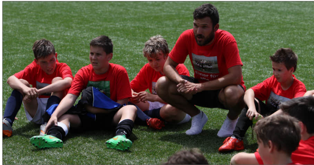
Trainer sind auch wichtige Bezugspersonen für Kinder und Jugendliche. Auf dem kostenlosen Ausbildungsworkshop des VSS am 12. November in Bozen geht es auch um diesen oftmals unterschätzten Aspekt.

Die erste Veranstaltung findet am Samstag, den 12. November 2016 von 9 bis 15.30 Uhr in der Aula der Wirtschaftsfachoberschule „Heinrich Kunter“ in Bozen statt. Im Mittelpunkt stehen dabei die Förderung des Kinder- und Jugendsports und die entsprechende Talentförderung. Es geht aber auch um die oftmals unterschätzte Rolle des