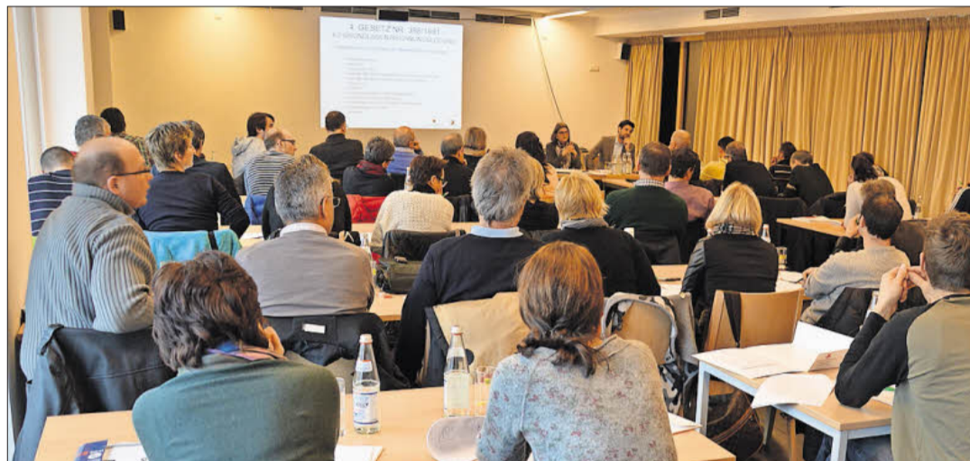
Mit dem neuen Jahr kommen zahlreiche steuerliche Änderungen auf die Vereine zu. Der VSS bietet im Jänner und Februar deshalb wieder Kurse für Vereinskassiere an.

Ab dem Finanzjahr 2017 gelten die Eintragung in das Register für die Zuwendungen der 5-Promille in den Steuererklärungen und die Ersatzerklärung nicht nur für ein Jahr, sondern auch für die folgenden Jahre. Eine Meldung ist nur mehr dann vorzunehmen, wenn sich Änderungen im Verein ergeben haben, oder ein Fehler bei der Eintragung passiert ist.