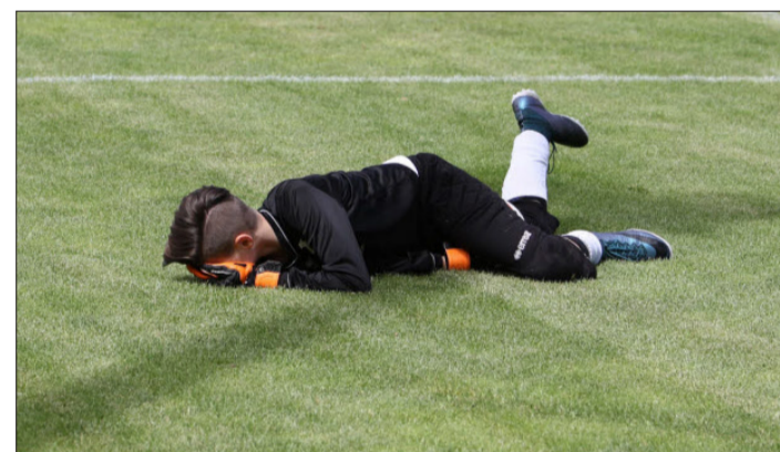
Ein Sportunfall kann schnell passieren, umso wichtiger ist eine zuverlässige Versicherung.

Bewährt hat sich die Strafrechtsschutz-Versicherung . Damit sichert der VSS die Funktionäre, Mitarbeiter, Trainer und Betreuer seiner Mitgliedsvereine