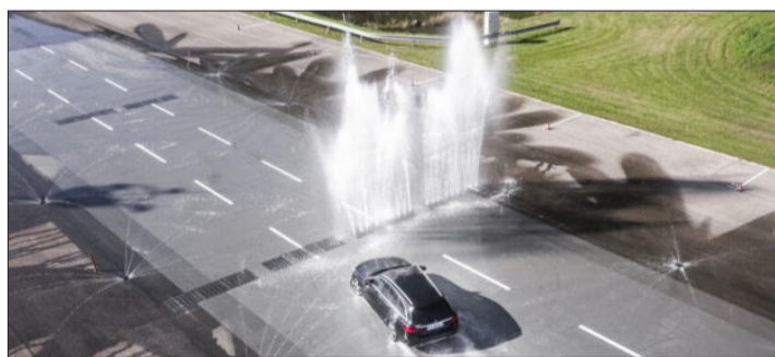
Sicherheit für Fahrer von Sportbussen mit dem Fahrsicherheitstraining im Safety Park.

FAHRSICHERHEITSTRAINING: Für Sportbusfahrer