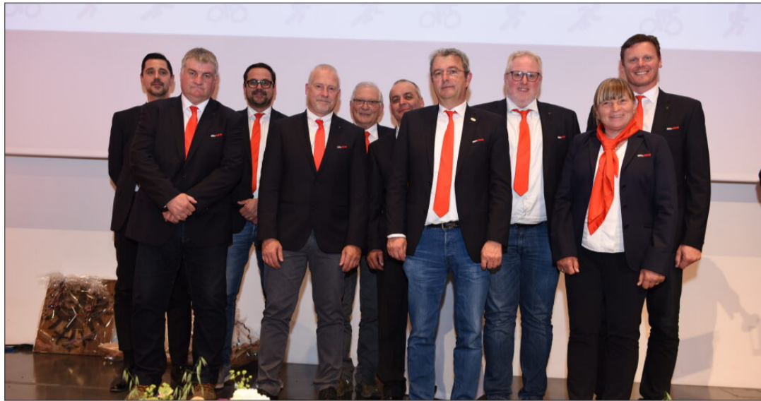
Der VSS-Vorstand freut sich auf zahlreiche Vertreter der Mitgliedsvereine.